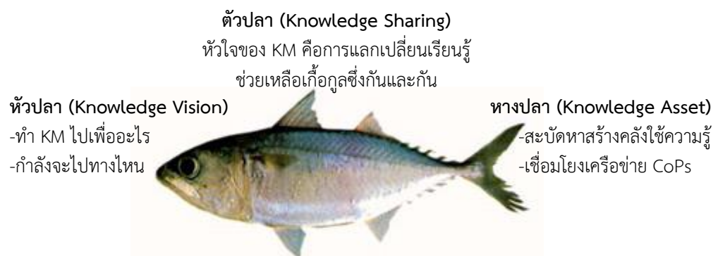
แผนภาพโมเดลปลา (ประพนธ์ ผาสุกยัต, 2549)

สถาบันส่งเสริมการจัดการความรู้เพื่อสังคม (สคส.) ได้เปรียบเทียบการจัดการความรู้เหมือนปลาหูหนึ่งตัวที่มี 3 ส่วน คือ หัวปลา ตัวปลา และหางปลา ถ้านำกระบวนการความรู้ทั้ง 7 ขั้นตอน มาใช้ร่วมกับโมเดลปลาสามารถนำมาประยุกต์ใช้ได้ดังนี้