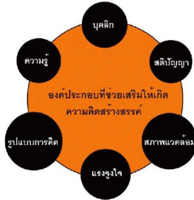
ภาพที่ 1 องค์ประกอบที่ช่วยเสริมสร้างความคิดสร้างสรรค์

3. การคัดเลือกแนวทางในการแก้ปัญหา โดยคำนึงถึงความเป็นไปได้ ซึ่งต้องอาศัยการวิเคราะห์ สังเคราะห์ และเลือกแนวทางการแก้ปัญหาที่ดีที่สุด ที่เหมาะสมกับบริบทของปัญหาหรือความต้องการนั้นๆ